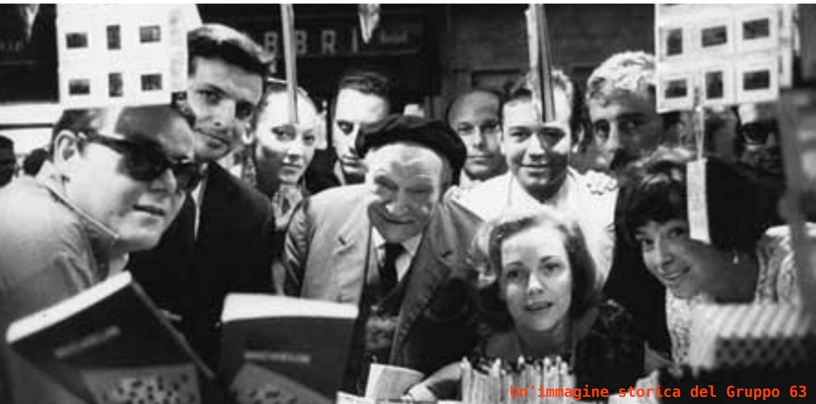
Un'immagine storica del Gruppo 63