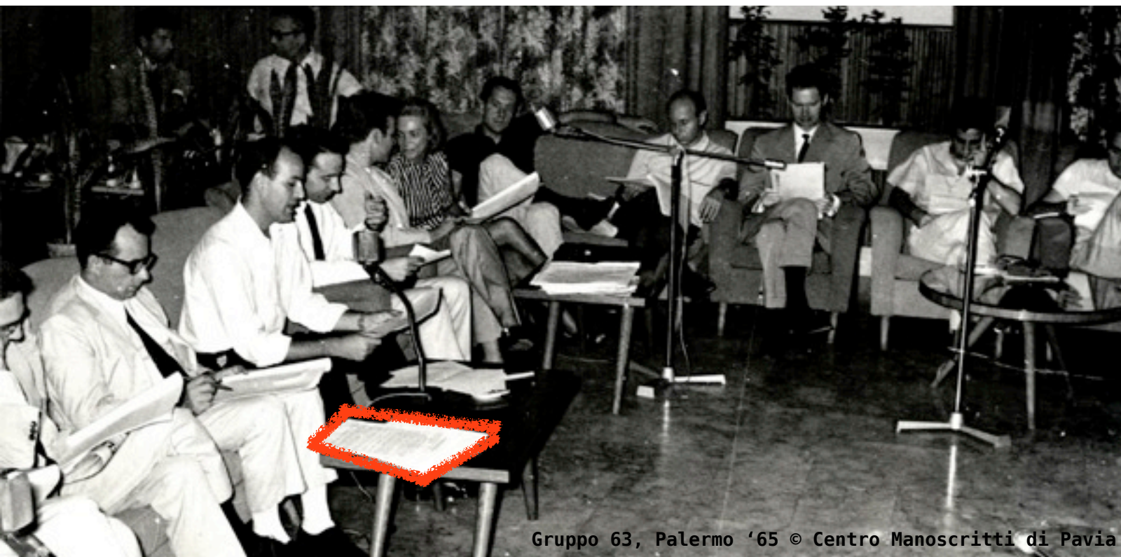
Gruppo 63, Palermo '65