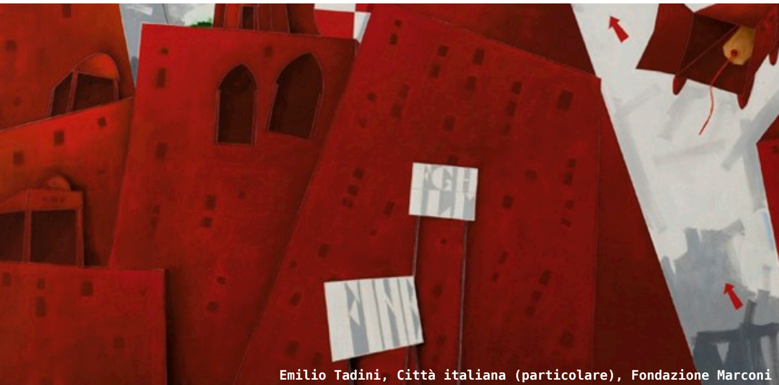
Emilio Tadini, Città italiana (particolare), Fondazione Marconi